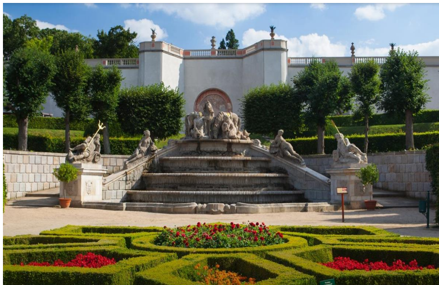
сад замка Добржиш