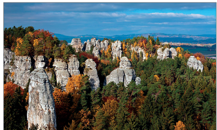
Hruboskalské skalní město