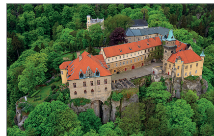
Zámek Hrubá Skála