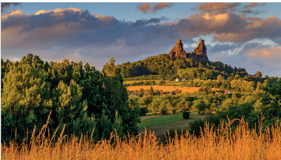
Zřícenina hradu Trosky