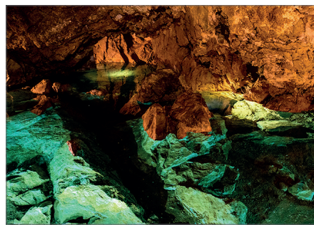
Bozkovské dolomitové jeskyně